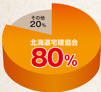
●不動産業者総数における、当協会会員の割合